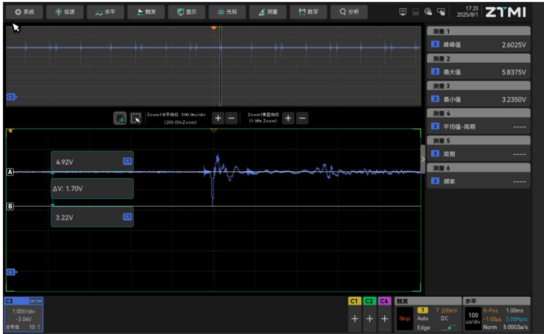
LM5148 21 脚 VOUT 对 PGND 电压波形