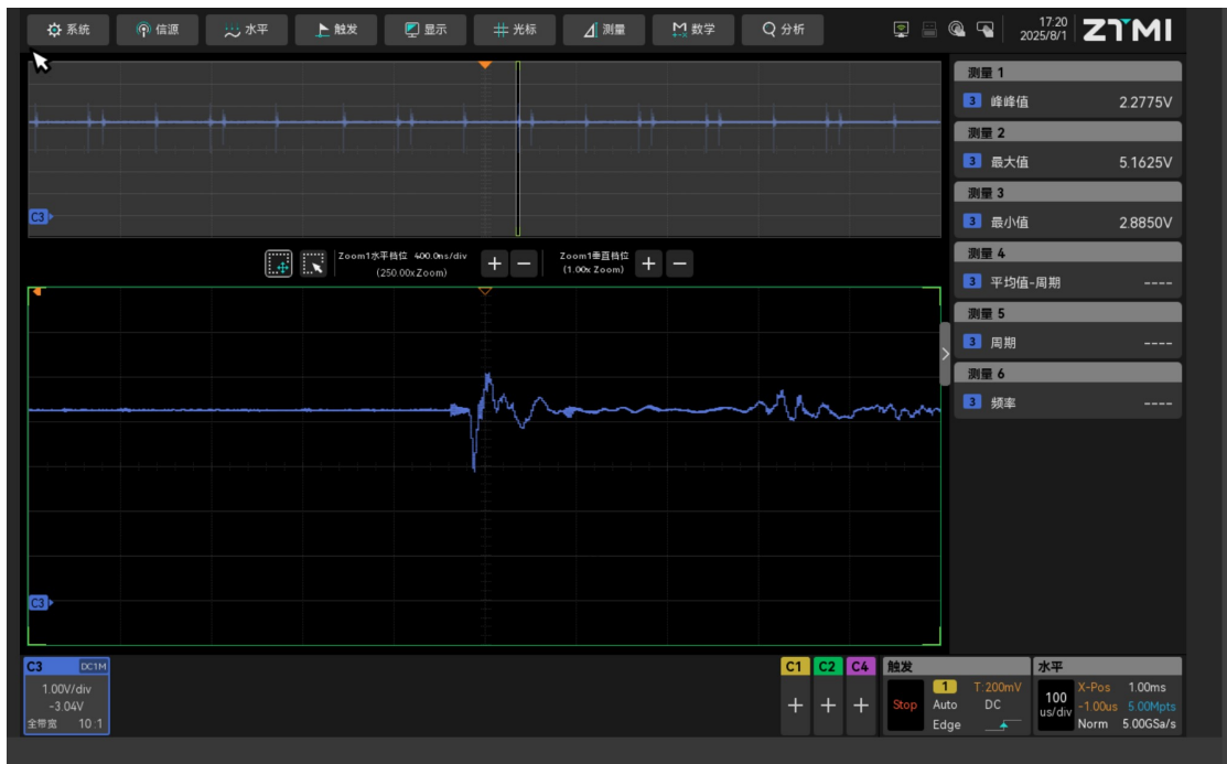
LM5148 20 脚 ISNS+对 PGND 电压波形