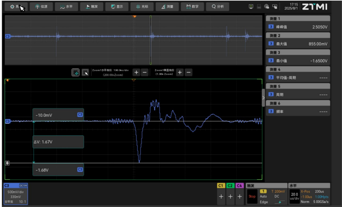
LM5148 11 脚 LO 对 PGND 电压波形